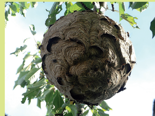
Nid constitué, pouvant atteindre 2,5 m de circonférence