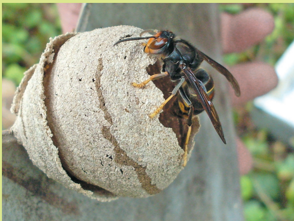
Frelon asiatique sur nid primaire