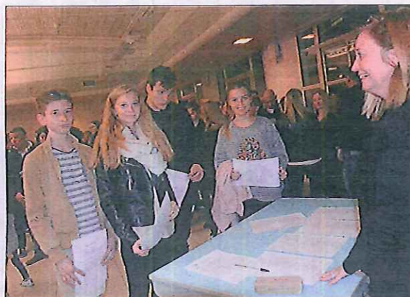
Des collégiens souriants venant récupérer le diplôme du brevet qu'ils ont réussi en fin d'année scolaire dernière.